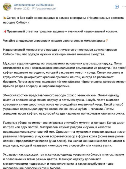
Рис 2. Проект «Национальные костюмы народов Сибири», посты от 15-го и 19-го июля 2022 г.